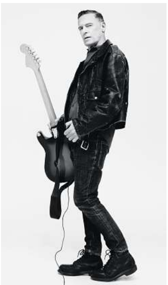
Bryan Adams stand schon lange auf der Wunschliste der Veranstalter.

HANNOVER. Die für Freunde klassischen Rocks gute Nachricht vorab: Der kanadische Musiker Bryan Adams, ein internationaler Superstar mit mehr als 100 Millionen verkauften Alben, wird als Hauptact beim diesjährigen Plaza-Festival auftreten. Die nicht ganz so gute Nachricht: Die Organisatoren – der NDR mit seinem Partner Hannover Concerts – haben aus diesem Grund keine drei Monate vor dem Event noch einmal massiv umgeplant.