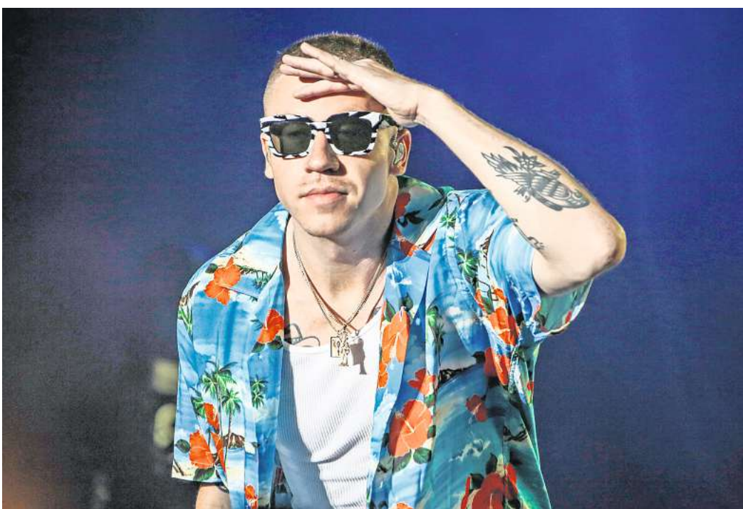
Macklemore bringt am Freitag bei der N-Joy Starshow die Plaza zum Beben.

of ‘69“, „Somebody“ und „It’s only love“ (mit Tina Turner) machten ihn in der Folge zu einem Superstar. Als Meister der gepflegten Rockballade erwies er sich in den Neunzigerjahren mit „Everything I do I do it for you“, der Titelmelodie aus „Robin Hood – König der Diebe“, und dem mit Sting und Rod Stewart aufgenommenen Lied „All for love“ (aus dem „Die drei Musketiere“-Soundtrack von 1994). In den vergangenen Jahren machte Adams sich auch einen Namen als Fotograf, oft von Kollegen. So stammt von ihm das Mo-