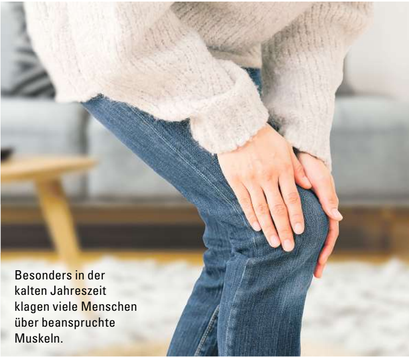
Besonders in der kalten Jahreszeit klagen viele Menschen über beanspruchte Muskeln.