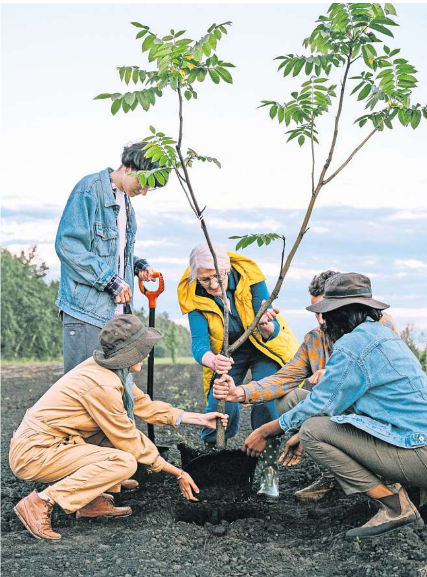
Gemeinsam engagiert: Ehrenamtliche Arbeit ist gefragt in Initiativen, Vereinen, Gemeinden und mehr.

Abgesehen davon, dass die Deutschen nach der Coronapandemie „nicht wieder so richtig in die gesellschaftliche Inter-