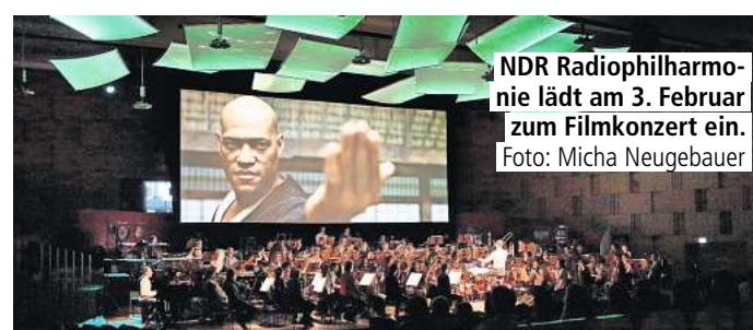
NDR Radiophilharmonie lädt am 3. Februar zum Filmkonzert ein.

Telefon KundenServiceCenter: 0800 / 0 01 92 14 (kostenfrei)