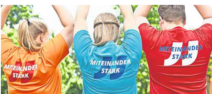
Teilnehmende einer Jugendstunde bei der Johanniter-Jugend zeigen auf ihren T-Shirts das Motto des Jugendverbands.