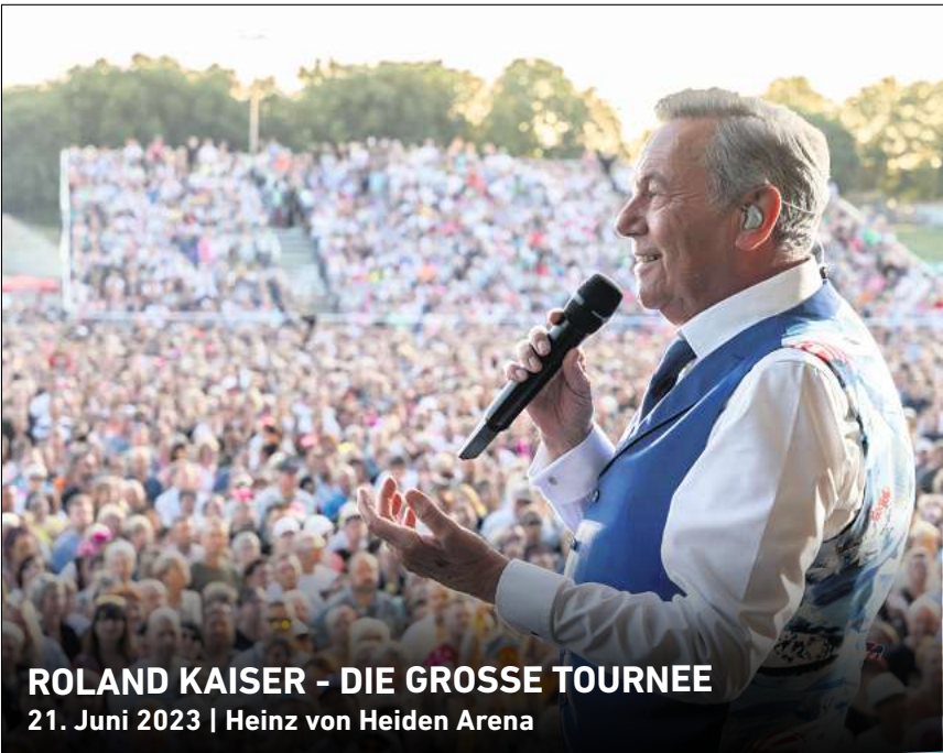
ROLAND KAISER - DIE GROSSE TOURNEE 21. Juni 2023 | Heinz von Heiden Arena

Ihr persönlicher Ticketservice der HAZ & NP