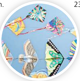
Der Kronsberg wird bunt beim Drachenfest.

Bis zum Sonntag, 24. September, ist das farbenfrohe Treiben zu bewundern. Alle können mitmachen und auf guten Wind hoffen. Ein besonderes Highlight ist für den Samstagabend, 23. September geplant: Der Weg vor den Wohnmobilen der angereisten Drachenvlieger – Achtung: keine freien Stellplätze mehr! – wird stimmungsvoll beleuchtet, und bei passenden Windverhältnissen wird es das illuminierte Drachensteigen beim „Nachtfliegen“ geben. Verden Himmel bunt zu bespielen. Denn es hat sich mittlerweile herumgesprochen, dass die Allmendefläche am Kronsberg (Kleinfeld) ein ideales Gelände zum Drachenvliegen ist.