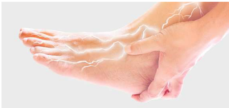
Brennen, Kribbeln oder Taubheitsgefühle in Füßen und Beinen sind häufig Begleiterscheinungen von Nervenschmerzen

Nervensystem und kommt laut Arzneimittelbild bei scharfen, schießenden Schmerzen längs einzelner Nervenbahnen zum Einsatz. Doch nicht nur das –