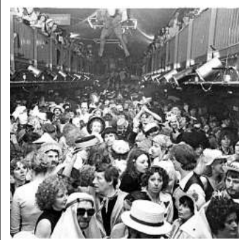
Kult-Location: die Rotation.