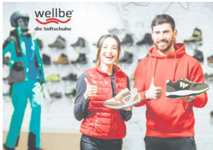
Das Team von ZOPICK, Walsroder Straße 41 in Langenhagen freut sich auf Ihren Besuch

wellbe die Softschuhe sind ultra leichte, weiche Komfortschuhe mit einfacher, sanfter Aktivität in