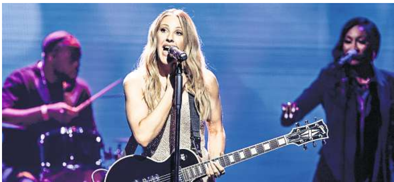
Auch Ellie Goulding steht beim NDR-2-Plaza-Festival am 8. September auf der Bühne.