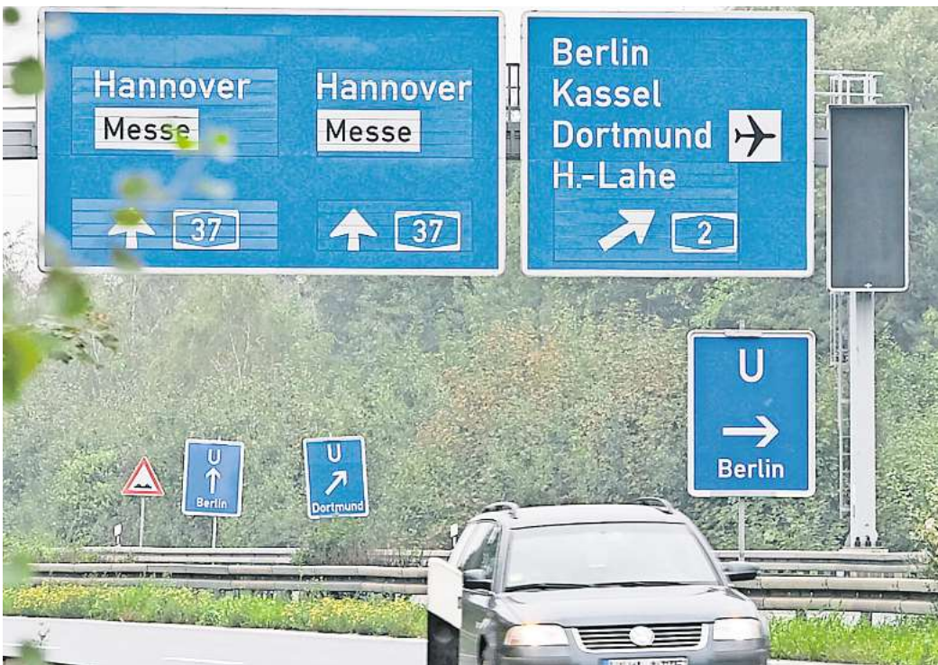
Die A37 wird grunderneuert: Zwischen den Anschlussstellen Misburg und Beinhorn ist jahrelang mit Einschränkungen zu rechnen.

Los geht es mit dem 4,3 Kilometer langen Abschnitt, der von