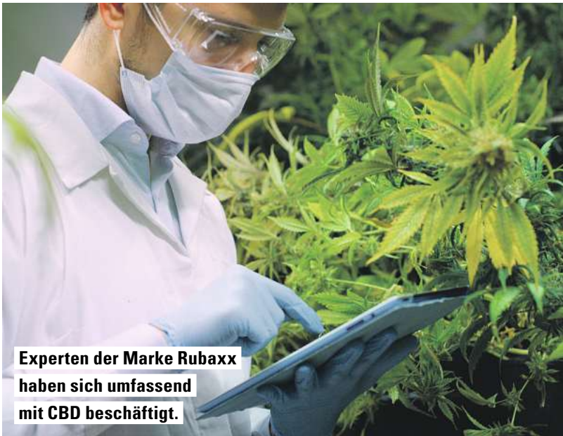
Experten der Marke Rubaxx haben sich umfassend mit CBD beschäftigt.

im Fokus steht und die Wissenschaft beeindruckt.