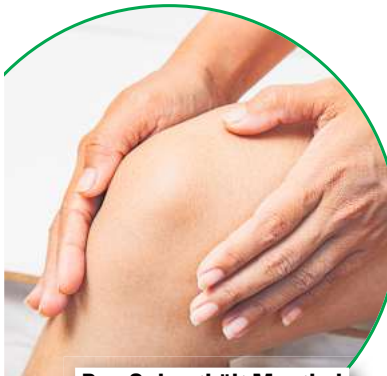
Das Gel enthält Menthol und Minzöl zur Pflege beanspruchter Muskeln.

CBD ist ein vielversprechendes Cannabinoid, das aus der Cannabispflanze gewonnen wird. Genauer gesagt ist es DER Stoff, der heute mehr denn je