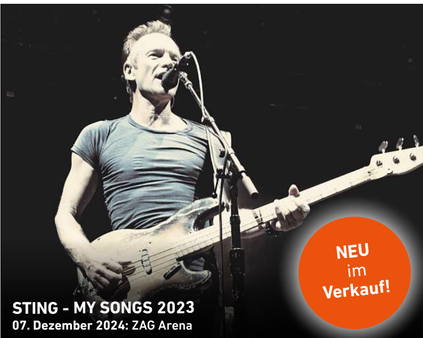
STING - MY SONGS 2023 07. Dezember 2024: ZAG Arena