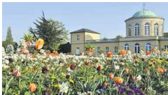
Die Gärten laden zum Frühlingsspaziergang ein.

➤ Alle Eintrittspreise und Ermäßigungen sind online auf herrenhausen.de zu finden.