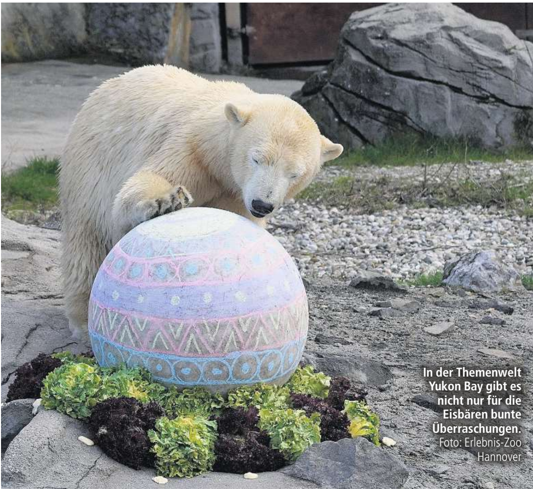
In der Themenwelt Yukon Bay gibt es nicht nur für die Eisbären bunte Überraschungen.

Über 30 Unterrichtsgänge und Workshops bietet die Zoolochschule an. Neu in diesem Schuljahr: Bionik – die Vorbilder der Natur. Erforscht wird, was Unterwasserroboter, selbstschärfende Messer und Dachkonstruktionen mit den Tieren des Zoos verbindet. Um möglichst vielen Schülerinnen und Schülern den Besuch zu ermöglichen, bietet der Zoo Hannover weiterhin die Schüler-Tagestickets für 5 Euro, für Partnerschulen für 3,50 Euro pro Person an. Neu ist ein Schulhalbjahres-Ticket, das es ab dem 12. April ermöglichen soll, den Zoo außerhalb der Ferien und Feiertage und im Rahmen der Bildung für nachhaltige Entwicklung (BNE) montags bis freitags von 9 bis 14 Uhr zu besuchen.