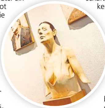
In sich gekehrt: Die Tänzerin Pina Bausch ist eine Arbeit von 2011.