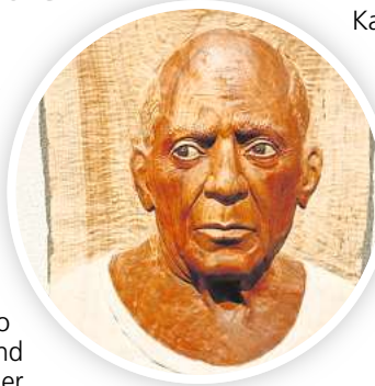
Reliefbildnis: Das Portrait von Picasso hat Reinbeck 2018 fertiggestellt.

Neben den Figuren fertigt er auch nach Fotovorlagen plastische Holzbilder an. Viele berühmte Leute, darunter die Künstler Joseph