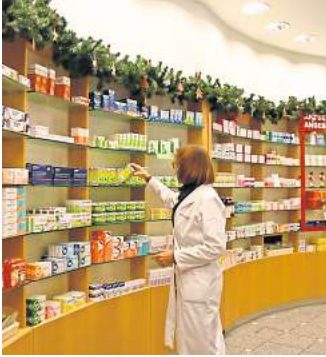
Banger Blick ins Regal: Die Arzneimittelkrise ist auf absehbarer Zeit nicht überwunden.

„Scharlach ist nach dem Infektionsschutzgesetz keine meldepflichtige Erkrankung, sondern muss nur bei Vorkommen in einer Gemeinschaftseinrichtung wie Kindergärten, Schulen oder