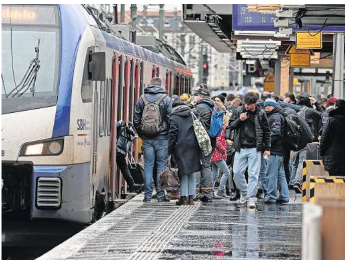
Verspätungen, Zugausfälle, zu wenige Wagen: Seit Transdev die S-Bahn in Hannover übernommen hat, herrscht Chaos.

men weist auf die Baustellen der Deutschen Bahn hin. Außerdem seien übernommene Altfahrzeuge der Bahn wegen diverser Mängel noch immer nicht einsatzfähig und noch in der Reparatur, sagt Block.