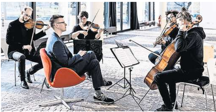
Das Orchester im Treppenhaus gibt im Rahmen der HörFidelity mehrere Konzerte.

Das vollständige Programm mit allen Angeboten und Anfangszeiten steht auf hörregion-hannover.de.