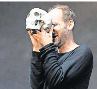
„Hamlet“ im Schauspiel Hannover.