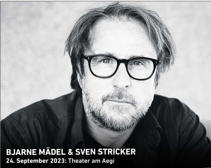
BJARNE MÄDEL & SVEN STRICKER 24. September 2023: Theater am Aegi

In den HAZ & NP Geschäftsstellen Hannover, Lange Laube 10 Neustadt, Am Wallhof 1 Burgdorf, Marktstraße 16 Langenhagen, im CCL, Marktplatz 5 Theater am Aegi, Aegidientorplatz 2