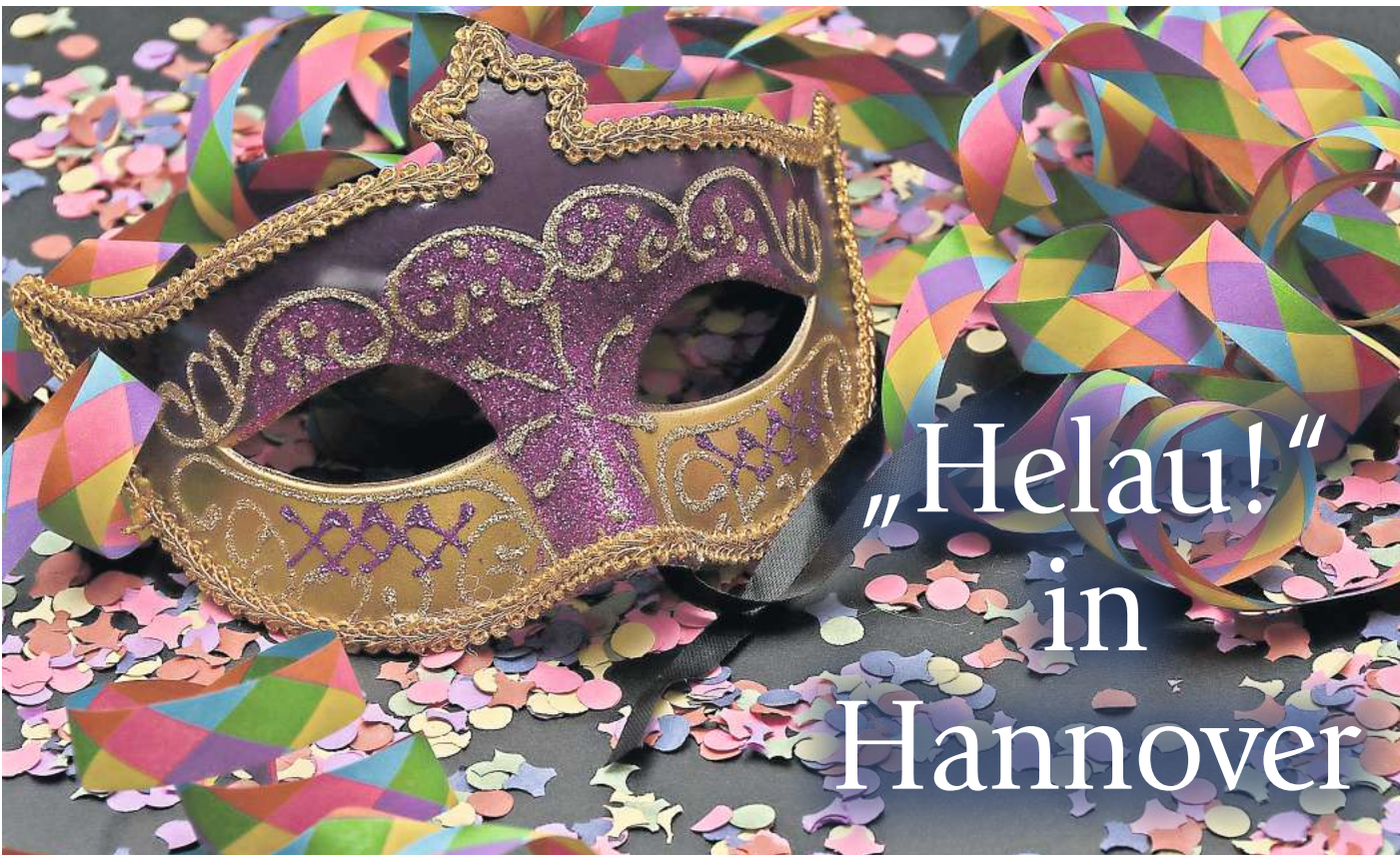
Konfetti, Kostüme und Kamelle: Auch in Hannover wird Karneval gefeiert.

Die Gala-Prunksitzung der Lindener Narren ist bereits ausverkauft. Wer sich Karten sichern konnte, wird ab 19.31 Uhr im Fritz-Haake-Saal erwartet.