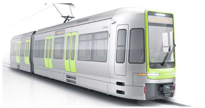
Ein Computermodell der neuen Bahnen haben Üstra und CAF bereits gezeigt.

Der Zuschuss könnte nächstes Jahr oder übernächstes Jahr fließen, meint er. Aus Sicht des Landes bestehe kein zeitlicher Druck. Das sehen die Grünen ähnlich, es reiche aus, den Landeszuschuss für die Stadtbahnen im Jahr 2024 zur Verfügung zu stellen, sagt die Landtagsabgeordnete Evrim Camuz.