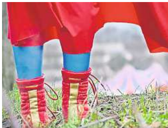
Über den Traum, zu fliegen: Gastproduktion „Der Mauersegler“.