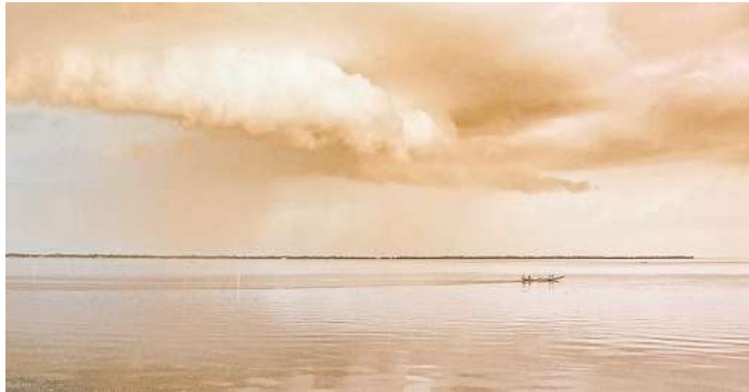
Fotos der Serie „Shaped to resist“ von Momen Mostafa dokumentieren die Flutkatastrophe in Bangladesch im Jahr 2022 und deren Auswirkungen auf die Menschen vor Ort.