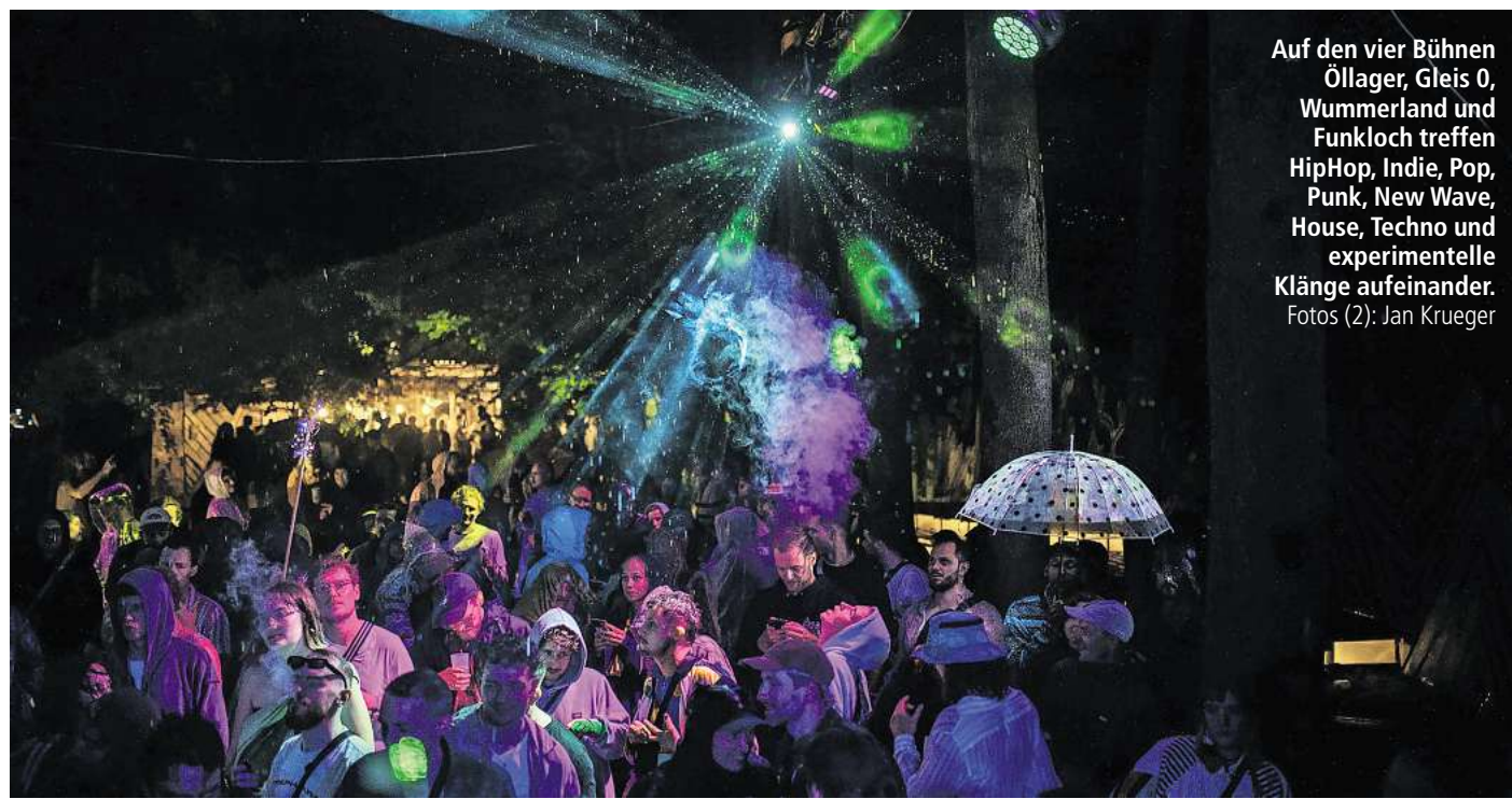
Auf den vier Bühnen Öllager, Gleis 0, Wummerland und Funkloch treffen HipHop, Indie, Pop, Punk, New Wave, House, Techno und experimentelle Klänge aufeinander.

Das passt zum Ort. Ein Festival im Straßenbahnmuseum bringt eine eigene Dramaturgie mit. Die alten Bahnen verbinden Bühnen und Geländeteile, der Wechsel zwischen den Spielorten wird selbst zum Teil des Erlebnisses. Statt eines abgeschlossenen Konzertareals entsteht ein Kulturparcours, bei dem Ankommen, Weiterfahren, Aussteigen und Wiederentdecken zusammengehören. Das SNNTG lebt von solchen Zwischenräumen: von Wegen, Ecken, Kunstinseln, Pausen im Grünen und Momenten, in denen nicht klar zwischen Programm und Atmosphäre zu trennen ist.