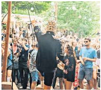
Das SNNTG ist kein Genre-Festival, sondern ein Ort für Entdeckungen – auf den Bühnen, auf dem Gelände, im Nachtprogramm und in den Momenten dazwischen.

Das Line-up liest sich entsprechend wie eine Einladung zum Streunen. Elektronische Acts wie Montezuma, orbit, Polaroi, bbtriebswirt, Konfusia, Hebün