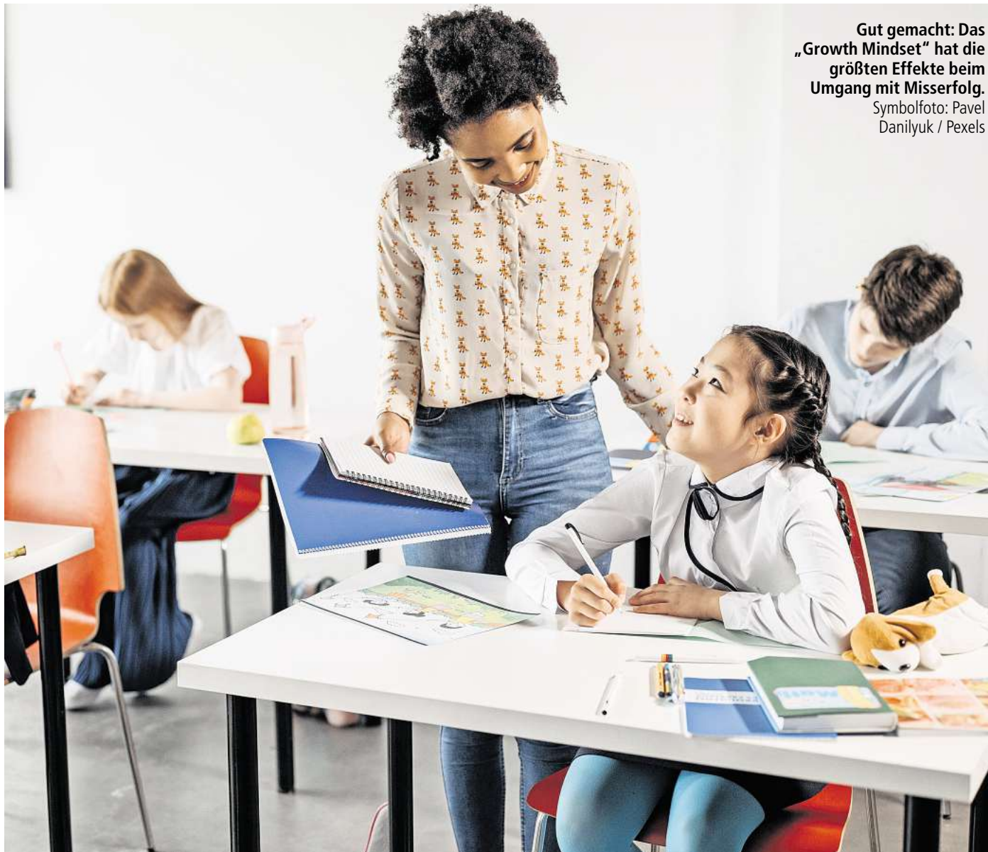
Gut gemacht: Das „Growth Mindset“ hat die größten Effekte beim Umgang mit Misserfolg.

Lange dachte man, das „Growth Mindset“ habe auch einen starken Effekt auf die Leistung. Anteil daran hatte auch der Entdeckerin, die US-Psychologieprofessorin Carol Dweck, welche den Nutzen des