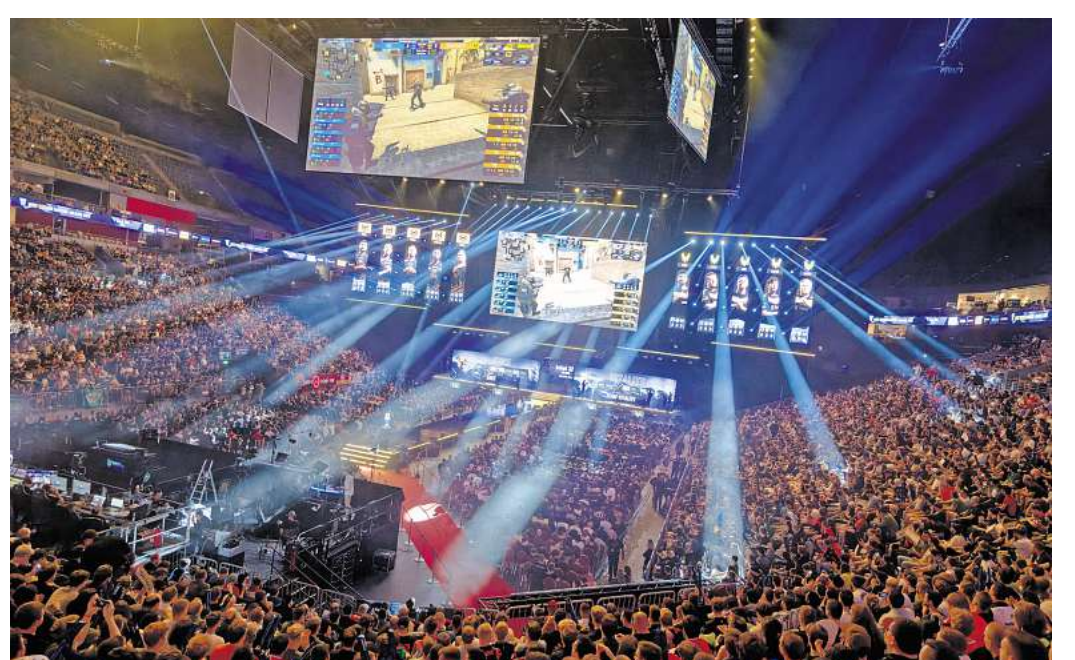
Volle Lanxess Arena: Zahlreiche Zuschauer verfolgen die E-Sport-Wettbewerbe auf der Leinwand.

Das ändert sich, seit Januar werden E-Sport-Vereine als gemeinnützig anerkannt. „Darauf