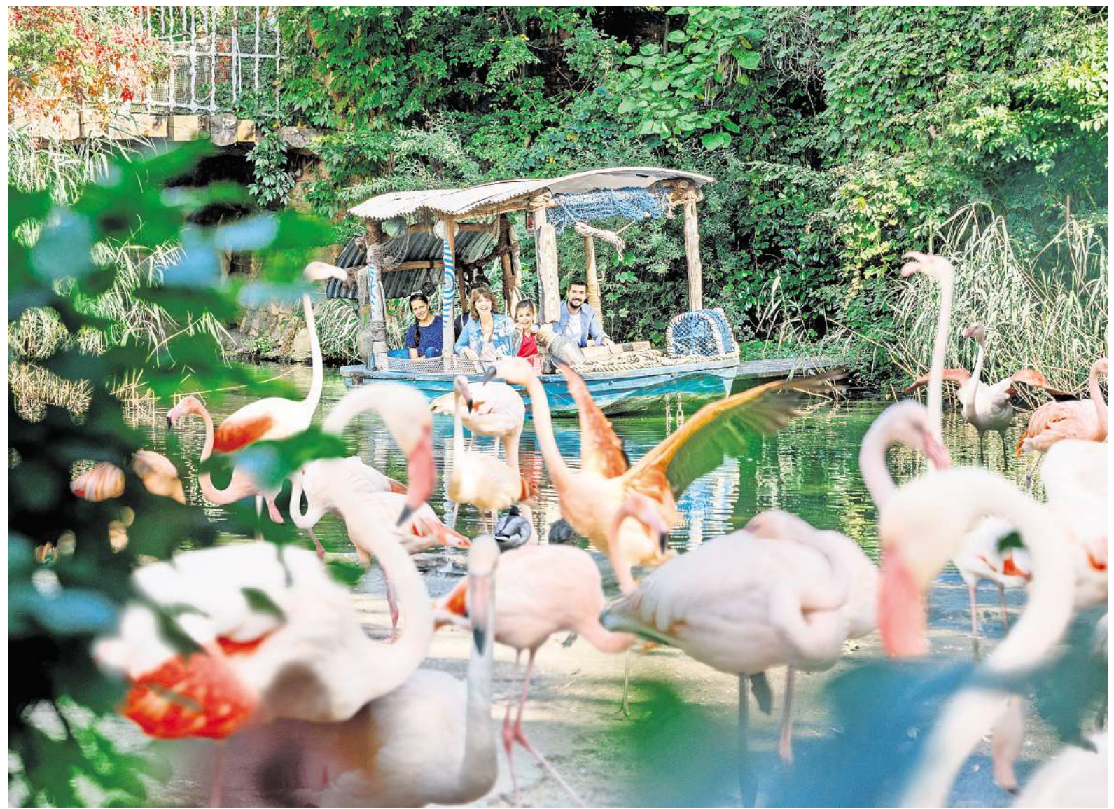
Teuer in der Unterhaltung: Der Zoo Hannover bietet unter anderem Bootsfahrten auf dem Sambesi an.

Andererseits habe der Zoo auch knapp eine Million Euro