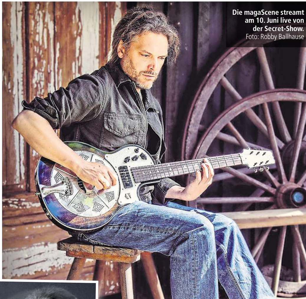
Die magaScene streamt am 10. Juni live von der Secret-Show.

Erscheint am 19.6.: Das neue Album „Still Moving“