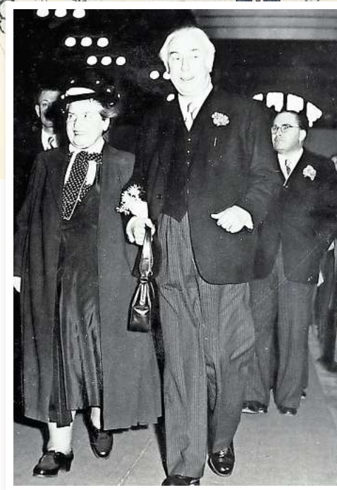
Kamen zur Eröffnung der Bundesgartenschau 1951: der damalige Bundespräsident Theodor Heuss und Ehefrau Elly Heuss-Knapp.

der Park in eine Bühne für Führungen, Konzerte, Lesungen und Mitmachaktionen.