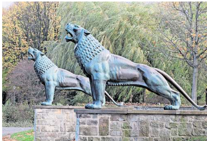
Die Bronzelöwen von Arno Breker an der Löwenbastion.

„Damals war er aber bei weitem noch nicht so bekannt wie in späteren Jahren, in denen er zum ‚Lieblingsbildhauer des Führers‘ avancierte und als