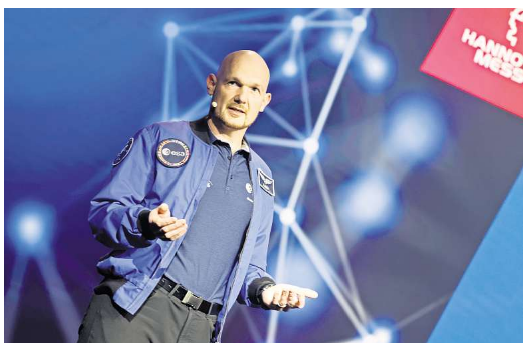
Ein Mann mit Wow-Effekt: Astronaut Alexander Gerst spricht auf der Center Stage der Hannover Messe.

Eins der Bilder, die er zum Talk auf der gut besuchten Center Stage 25 mitgebracht hatte, zeigte einen Supertaifun, den er fotografiert hat: „Sie sind schön, aber auch besorgniserregend, weil man weiß, dass Menschen in Not sind.“ Während der ersten Mission hatte er Supertaifun