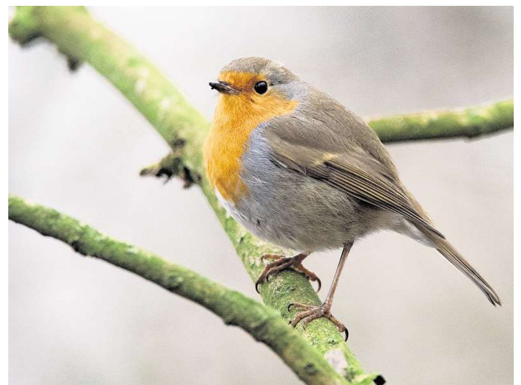
Gartenvögeln kann man eine Futtersäule im Garten oder auf dem Balkon spendieren. Eichhörnchen und Vögel brauchen bei Frost Trinkwasser.

Wildkatzen, Füchse, Wildschweine, Wölfe, Rehe und Rothirsche sind im Winter aktiv. Sie haben sich ein dickeres Fell zugelegt und passen ihre Aktivität den Witterungsverhältnissen an. Rothirsche etwa verkleinern Magen und Organe, um mit weniger Nahrung auszukommen. Während Huftiere jede Form von Anstrengung vermeiden, gehen Füchse, Wildkatzen und Wölfe im Winter sogar auf Jagd. Wildschweine haben eine dicke Unterwolle, die Nässe und Kälte von der Haut abhält. Wird es sehr eiskalt, kuschelt sich die Rotte im Unterholz aneinander und wärmt sich gegenseitig. Gartenvögel wie Amseln, Meisen oder Rotkehlchen bleiben ebenfalls im Winter wach und gehen auf Nahrungssuche. Schutz suchen sie in dichten Hecken und Büschen. Eichhörnchen halten Winterruhe, Winterschlaf halten Garten- und Siebenschläfer, Haselmaus, Alpenmurmeltier, Feldhamster und Igel. Sie fahren