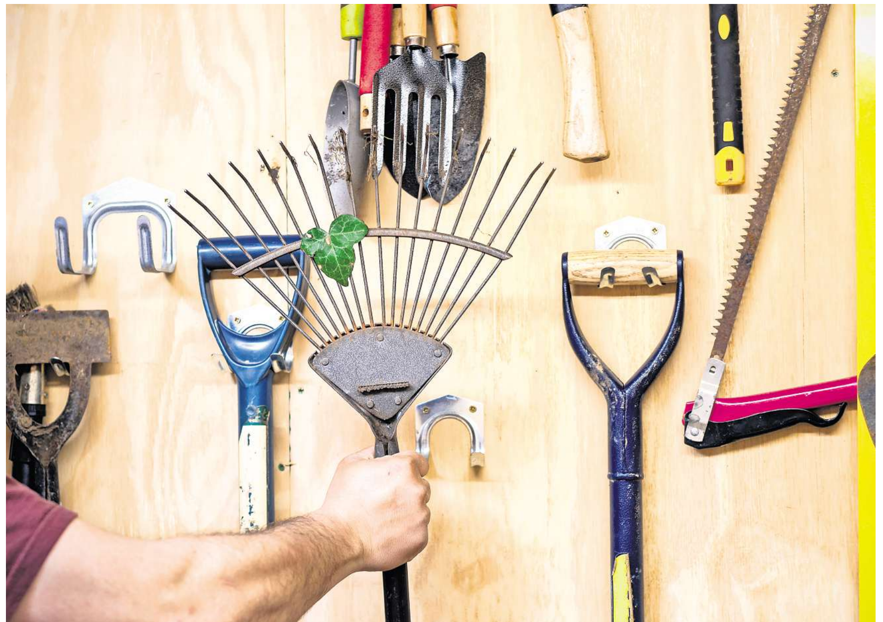
Stumpfe Werkzeuge machen die Gartenarbeit nicht nur anstrengender, sondern auch weniger effektiv.

Nach Reinigung und Schliiff steht der Schutz vor Rost und Verschleiß an. „Alle Metallflächen sollten mit einem feinen Ölfilm überzogen werden, um sie vor Feuchtigkeit zu schützen“, empfiehlt Surburg. Für Schneidekanten reiche herkömmliches Pflanzenöl vollkommen aus, alternativ eigne sich auch spezielles Rostschutzöl. Scharniere von Scheren oder Astsägen sowie Gewinde von Teleskopstielen oder verstellbaren Geräten erfreuten