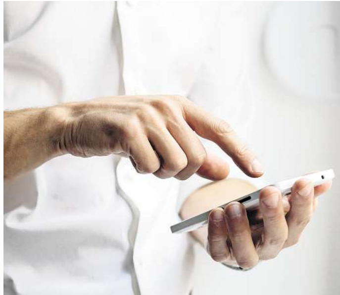
Kriminelle nutzen oft private Messenger-Dienste: Kommunikation per Anruf oder über die Verkaufsplattform kann das Risiko minimieren, Opfer eines Raubüberfalls zu werden.