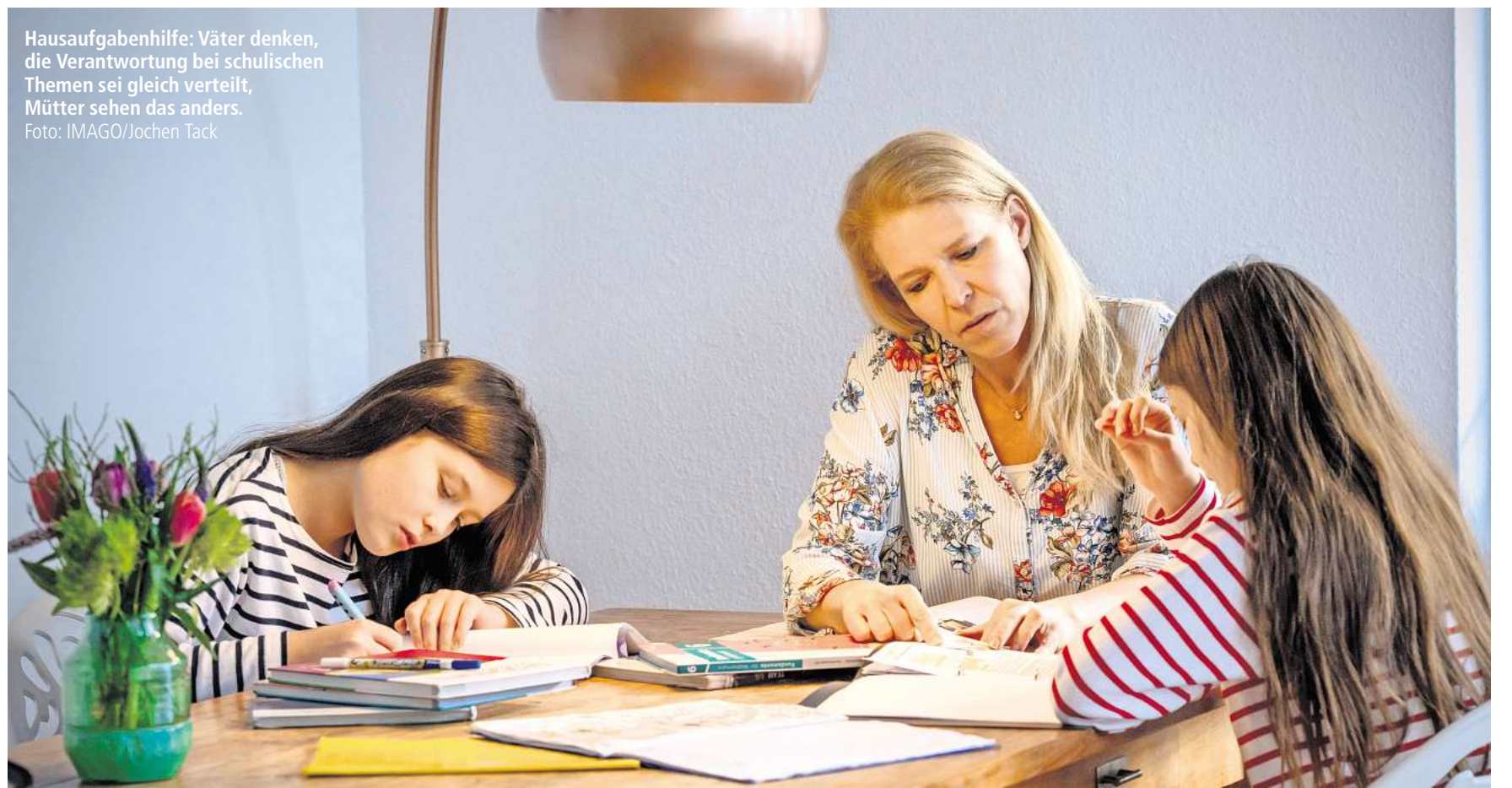
Hausaufgabenhilfe: Väter denken, die Verantwortung bei schulischen Themen sei gleich verteilt, Mütter sehen das anders.

An den Schulen ist die Ganztagsbetreuung ein Beispiel für eine strukturelle Maßnahme, die von der Bundesregierung eingeführt wurde, um die Vereinbarkeit von Familie und Beruf zu erhöhen. Sie soll zudem Kindern unabhängig von ihrer finanziellen Herkunft bessere Bildungschancen eröffnen.