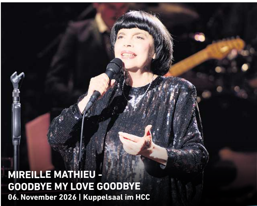
MIREILLE MATHIEU - GOODBYE MY LOVE GOODBYE 06. November 2026 | Kuppelsaal im HCC

Ihr persönlicher Ticketservice der HAZ & NP