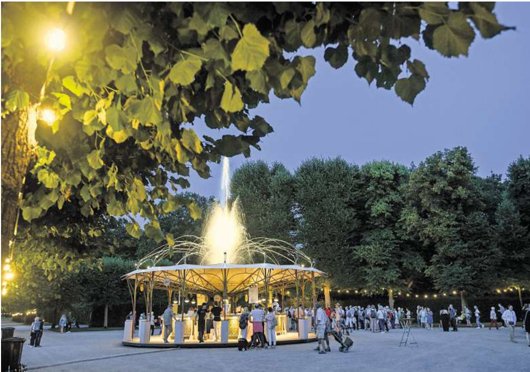
Kleines Fest im Großen Garten: Auch in diesem Jahr wird das abwechslungsreiche Programm die Besucher verzaubern und zum Staunen bringen.

108 Künstlerinnen und Künstler aus 20 Ländern: Programm für DAS KLEINE FEST IM GROßEN GARTEN steht