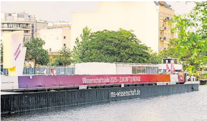
Die Ausstellung befindet sich im Bauch eines umgebauten Frachtschiffes.

künstlichen Blatt – seine Kombination von Photovoltaik und Elektrolyse in einer einzigen Zelle könnte in Zukunft grünen Wasserstoff im großen Stil produzieren. Wo und wie Wasserstoff eingesetzt werden kann, ist Thema weiterer Mitmach-Stationen.