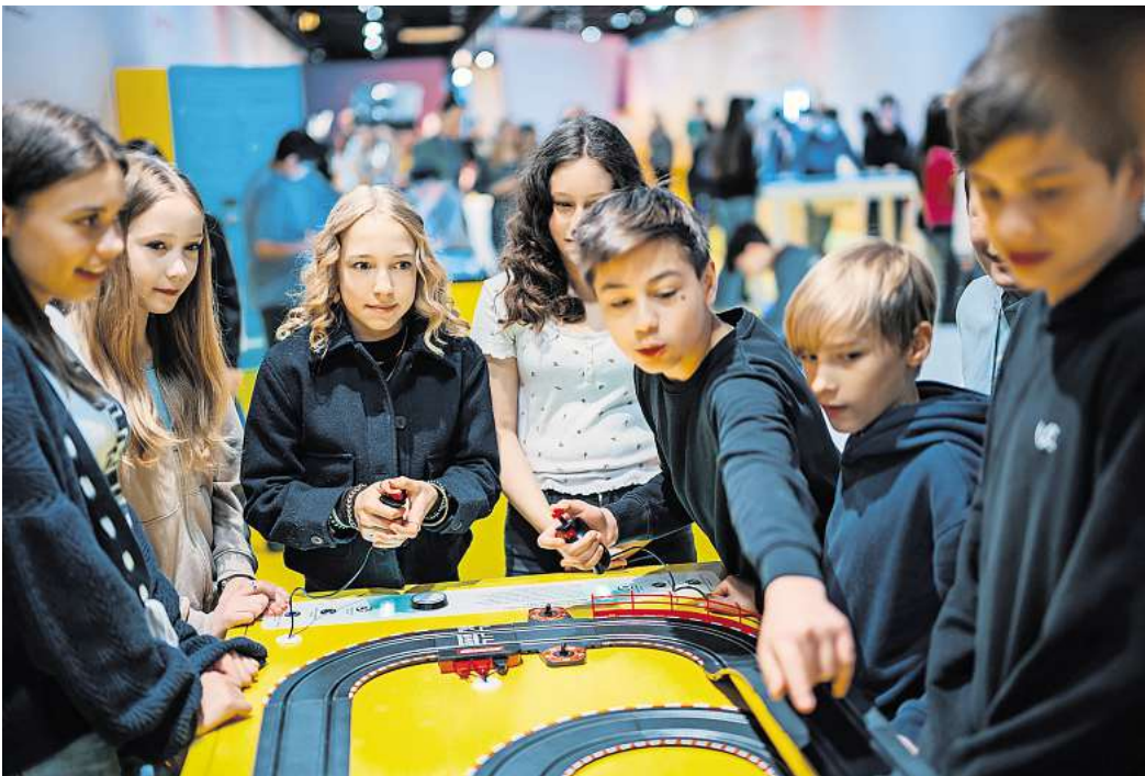
An rund 30 Exponaten können kluge Köpfe selbst aktiv werden und Fragen zur Energieversorgung der Zukunft nachgehen.

Das Helmholtz-Zentrum Heron experimentiert mit einem