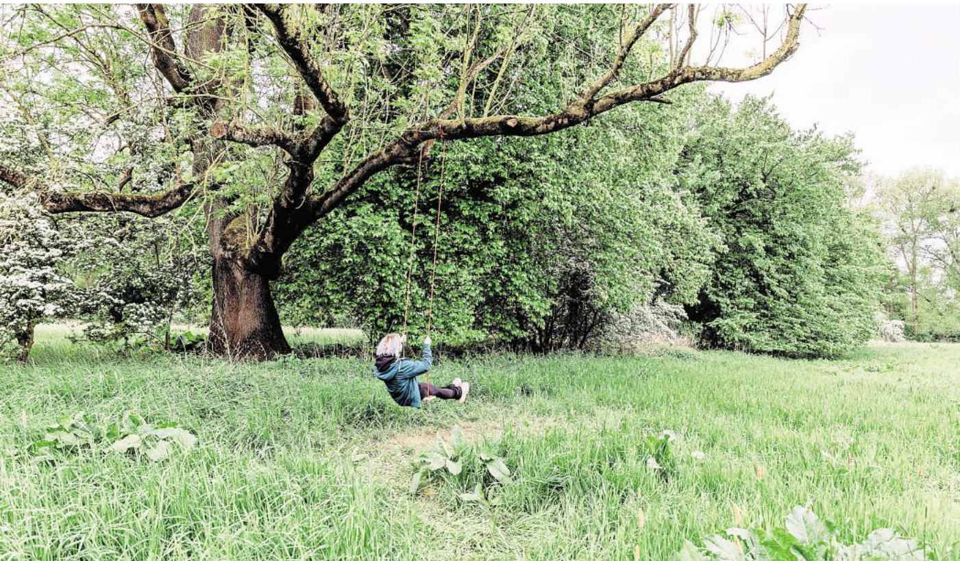
Nur Fliegen ist schöner: Kathrin und ihre Schaukelguerilla haben ihr Ziel erreicht und die 100. Schaukel aufgehängt – doch damit nimmt das Schaukeln erst richtig Fahrt auf – denn ständig kommen neue hinzu.