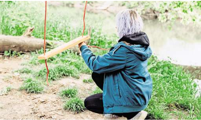
Die Schaukelguerilla hängt Schaukeln überall dort auf, wo es sich gut schaukeln lässt – damit immer mehr kleine und große Menschen Spaß am Kindsein haben.

Dann malt sie auf ein neues Brett die Zahl 107. So weit ist sie inzwischen. Das hängt sie in den Leineauen auf, direkt am Wasser. Ein Spaziergänger bleibt spontan stehen, beobachtet sie. „Es gibt doch nichts Schöneres, als unter einem Baum so zu schaukeln“, schwärmt er.