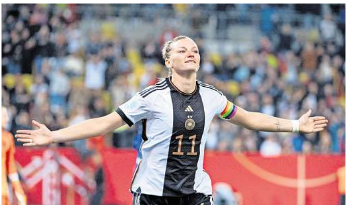
Hat oft gejubelt: Die Nationalspielerin Alexandra Popp.

Karten für den NP-Anstoß am 24. April mit freien Getränken und Pausenimbiss in der Alten Druckerei gibt es nicht zu kaufen, Sie können aber kostenlos dabei sein. Wir verlosen 30-mal zwei Karten. Scannen Sie einfach den QR-Code – und machen auf unserer Aktionsseite mit bei unserem Gewinnspiel.