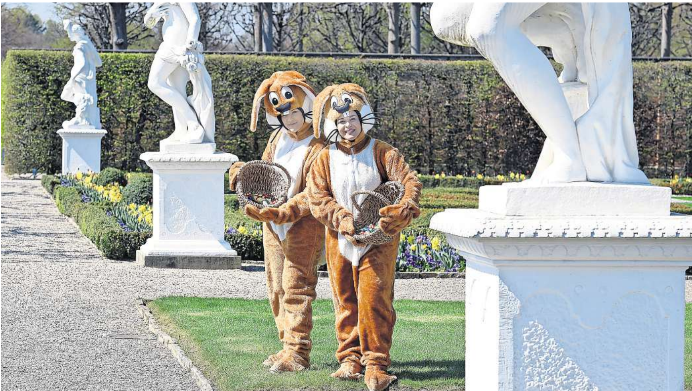
Im Großen Garten verteilen die Osterhasen Süßes für die kleinen Gäste.

Der mit Frühlingsblumen geschmückte Große Garten lädt am Ostersonntag, 20. April, zum traditionellen Osterspaziergang