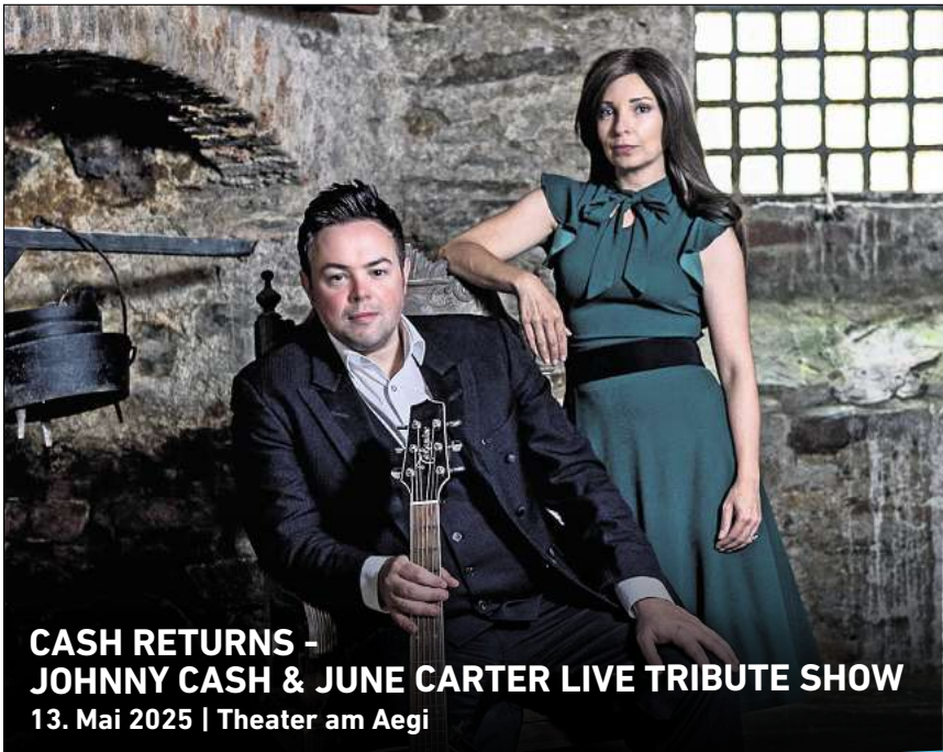
CASH RETURNS - JOHNNY CASH & JUNE CARTER LIVE TRIBUTE SHOW 13. Mai 2025 | Theater am Aegi

Ihr persönlicher Ticketservice der HAZ & NP