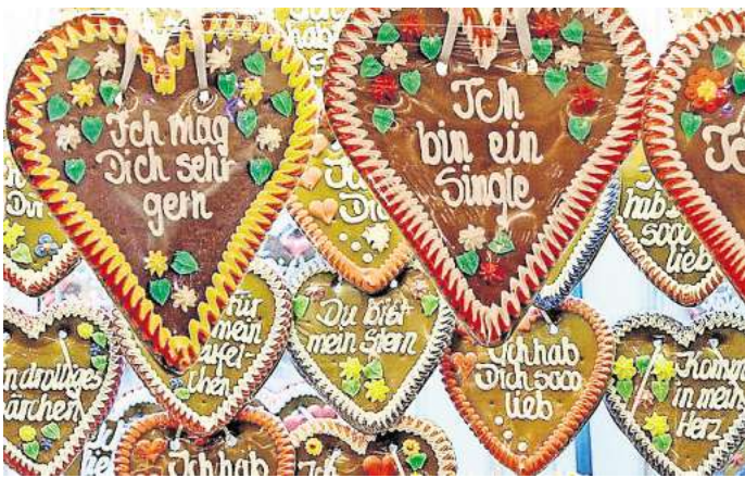
Bald wieder da: Lebkuchenherzen mit flotten Sprüchen.