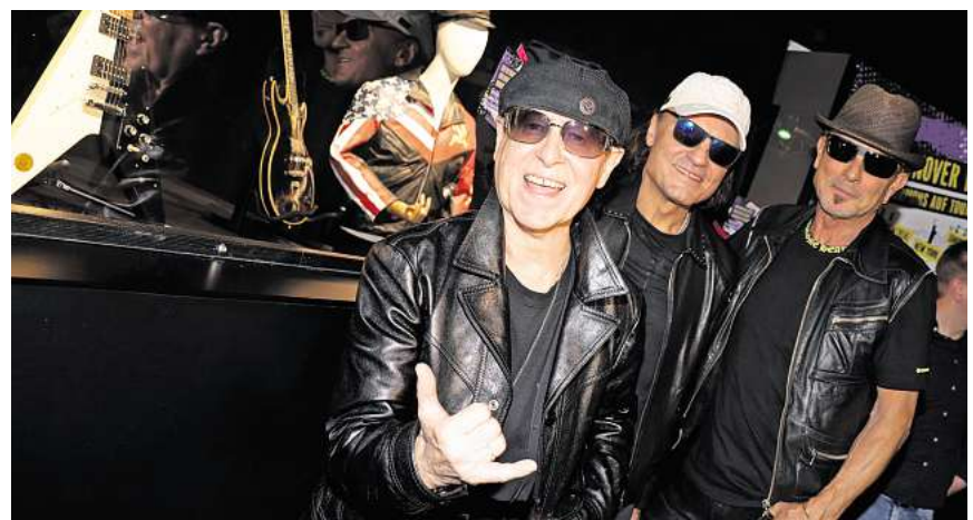
Klaus Meine, Matthias Jabs und Rudolf Schenker bei der Eröffnung der Rockstage im Flughafen Hannover.

Bandgründer Rudolf Schenker zeigte sich geschmeichelt von so viel Ehrerbietung. Er erinnerte daran, dass die Rock-Propheten im eigenen Land lange wenig galten. „Wir haben lange wenig Zuwendung aus Hannover und generell aus Deutschland bekommen – wir mussten uns dafür ins Ausland verdrücken“, sagte er. „Jetzt aber bekommen wir sie im Überfluss.“