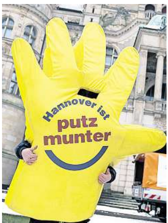
Maskottchen Putzi ist auch beim Abschlussfest dabei.