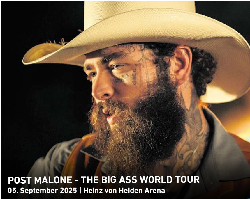
POST MALONE - THE BIG ASS WORLD TOUR 05. September 2025 | Heinz von Heiden Arena

Ihr persönlicher Ticketservice der HAZ & NP