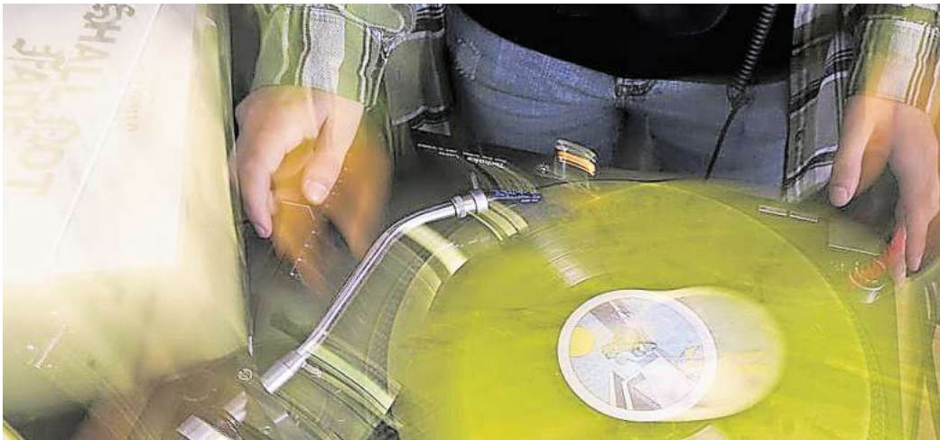
HörFidelity: Unter anderem gibt es einen Workshop rund um Tontechnik.

☐ Alle Informationen zum Programm sind abrufbar unter hoerregion-hannover.de