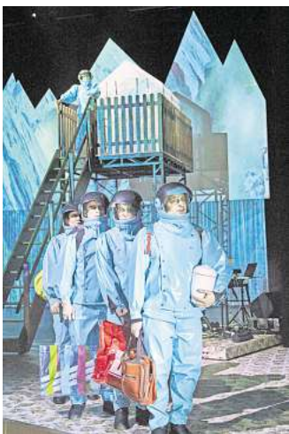
Mensch und Erde: Das Schauspiel Hannover zeigt das Stück „Asche“.

dem Warum. Wie konnte es soweit kommen? Sie hat Antworten, und präzise und unerbittlich in der Analyse beschreibt sie den Weg, der keinen Ausweg bereithält, nur ein Ende. Auch wenn es schwer vorstellbar bleibt, so ist der Tod doch unausweichlich.