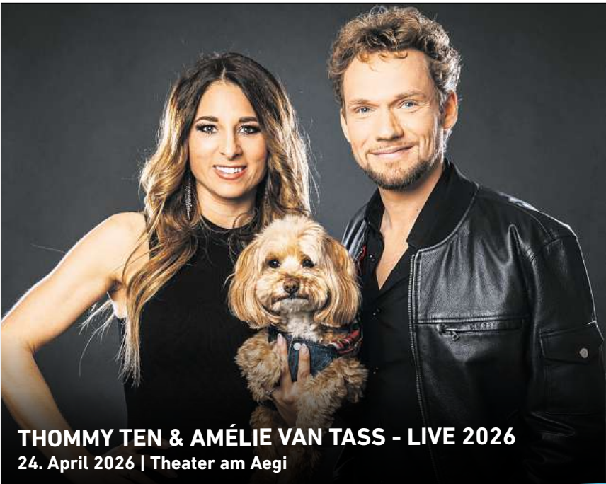
THOMMY TEN & AMÉLIE VAN TASS - LIVE 2026 24. April 2026 | Theater am Aegi

HANNOVER. Im Freizeitheim Döhren, An der Wollebahn 1, gibt es für Kinder von sechs bis zwölf Jahren die Möglichkeit, sich in einem Kreativ-Workshop künstlerisch auszuleben. An drei Terminen, beginnend am 10. Februar ab 16.30 Uhr, geht es darum, sich spielerisch und intuitiv mit verschiedenen Materialien auseinanderzusetzen, Techniken auszuprobieren und eigene Kunstwerke zu erschaffen. Ohne strenge Vorgaben und ohne ein Richtig oder Falsch. Die Teilnahme kostet für drei Termine 15 Euro, mit Aktivpass 7,50 Euro. Eine Anmeldung ist erforderlich per E-Mail an fzh-doehren@hannover-stadt.de . Ein weiterer Workshop findet am dem 5. Mai statt. RED