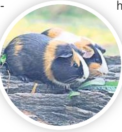
Meerschweinchen sind eines der Themen im Schulbiologiezentrum.

Jahren auf dem Programm, der Workshop wird geleitet von Michelle Udin. Für beide Tierbeobachtungen gilt eine Beschränkung der Teilnehmeranzahlen auf maximal 16 Personen. Das Team des Schulbiologiezentrums bittet daher um Verständnis, wenn nicht alle Angebote wie gewünscht besucht werden können. Ein rechtzeitiges Erscheinen ist Voraussetzung, der Zugang erfolgt ausschließlich über den Eingang Vinnhortsanger Weg 2. Der Eintritt ist frei, eine Spende für das Schulbiologiezentrum jedoch immer gern gesehen. R/H/R