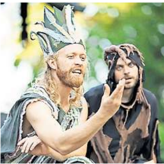
„A Midsummer Night's Dream“

HANNOVER. The American Drama Group Europe präsentiert ein Theaterstück in englischer Sprache: „A Midsummer Night's Dream“ von William Shakespeare kommt am Dienstag, 11. Februar, im Theater am Aegi zur Aufführung. In der beliebten Komödie geht es an den Hof der Elfenkönigin, wo es zu einem verwirrenden Liebesreigen, einem Malheur mit einem Zauberspruch und schrägen Missverständnissen kommt. Das reisende TNT theatre Britain zeigt hier ein leicht zugängliches Shakespeare-Stück, das auch für Personen geeignet ist, die Englisch nicht so fließend beherrschen, wie es auf ihrem Lebenslauf steht. Vorstellungstermine sind ab 11 Uhr sowie ab 19 Uhr, Einlass jeweils eine Stunde vorher. Eintrittskarten gibt es ab 30 Euro, ermäßigt ab 14 Euro im Vorverkauf auf adg-europe.com . R/H/R