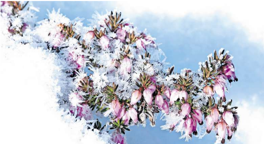
Schön als Bodendecker: Die Winterheide oder Schneeheide wird als immergrüner Zwergstrauch maximal 50 Zentimeter hoch.

Der Seidelbast (Daphne mezereum) hat viele rosa- bis fliederfarbene Blüten, die in Büscheln an den Zweigenden wachsen. Er