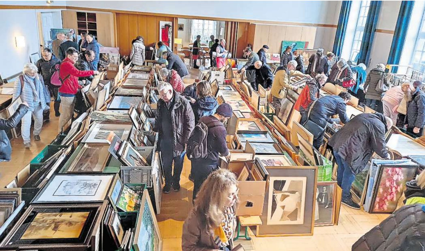
Großer Andrang beim „Sturm auf Schmuck und Bilder“ der Johanniter Hilfgemeinschaft.