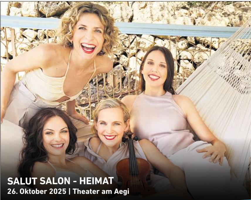
SALUT SALON - HEIMAT 26. Oktober 2025 | Theater am Aegi

Ihr persönlicher Ticketservice der HAZ & NP