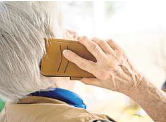
Telefonieren mit dem Smartphone ist auch ein Thema im Kurs.

HANNOVER. Erstes Smartphone oder iPhone? In der Begegnungsstätte des Kommunalen Seniorenservice Hannover in der Rodewaldstraße 17 in Kleefeld findet vom 8. Januar bis zum 26. März immer mittwochs von 14 bis 15.30 Uhr (12 Termine) ein neues Smartphone-Angebot für Anfänger*innen statt. Themen sind unter anderem: telefonieren, Nachrichten versenden, fotografieren, Suche im Internet etc. Die Teilnahme ist kostenfrei. Eine Anmeldung bis 7. Januar ist aufgrund begrenzter Plätze erforderlich unter der Telefonnummer 01 62/5 40 52 33 (evtl. bitte auf AB sprechen, Rückruf erfolgt).