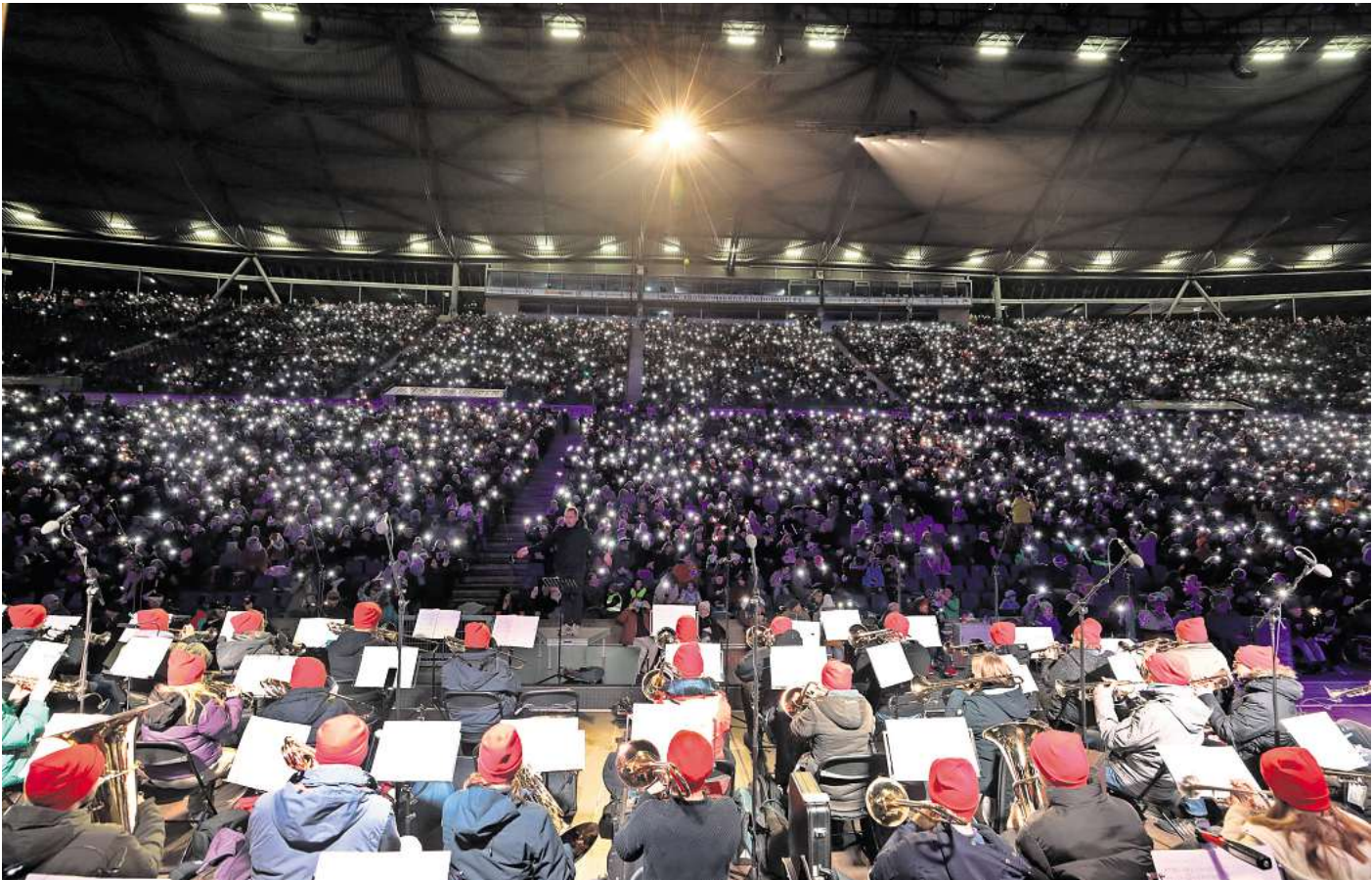
Schöner Anblick: Das Stadionsingen im letzten Jahr.

Wie wird das Wetter? Die Prognose geht von leichten Plusgraden und geringer Regenwahrscheinlichkeit aus.