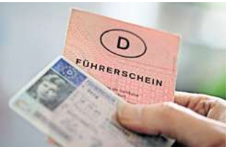
Alte Führerscheine müssen umgetauscht werden.

In der ersten Jahreshälfte waren die Probleme bei der Regionsführerscheinstelle gravierend. Leserinnen und Leser berichteten von monatelangen Wartezeiten auf neue Führerscheine. Die Region führte zum einen an, dass mehrere Stellen unbesetzt seien und insgesamt Personal fehle. Zum anderen habe sich die Zahl der Anträge im Vergleich zur Vor-Corona-Zeit verdoppelt. Das habe vor allem mit dem verpflichtenden Umtausch alter Führerscheine in neue EU-Plastikkarten zu tun, hieß es.