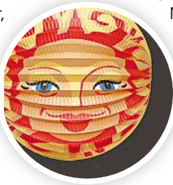
Zeit für bunte Laternen.

Am Springbrunnen auf dem Vahrenheider Markt treffen sich die Laternelaufenden am 15. November um 18 Uhr, es geht dann durch den Grünzug mit einem musikalischen Zwischenstopp beim Seniorenheim Erlenhof. R/HR