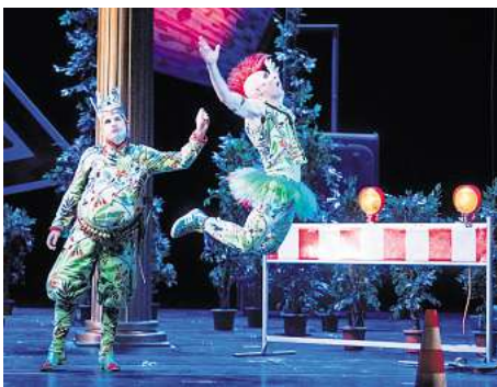
Sommernachts Traum in der Staatsoper.