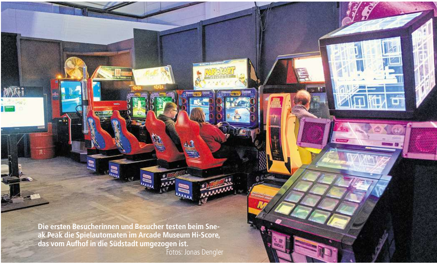
Die ersten Besucherinnen und Besucher testen beim Sneak Peak die Spielautomaten im Arcade Museum Hi-Score, das vom Aufhof in die Südstadt umgezogen ist.