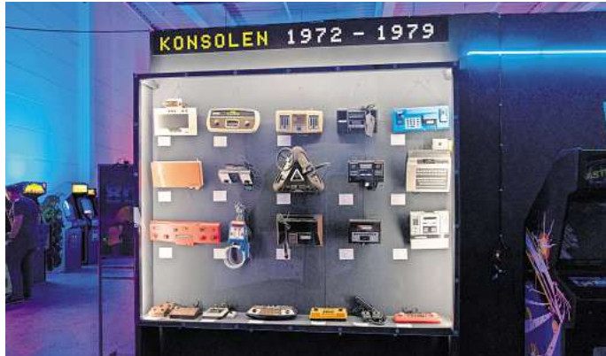
Im Hi-Score stehen neben den funktionierenden Spielautomaten aus den 70er- bis 90er-Jahren auch Installationen von Wohnzimmern mit Konsolen und lebensgroße Actionfiguren.