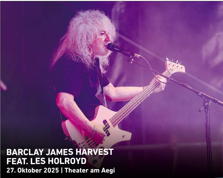
BARCLAY JAMES HARVEST FEAT. LES HOLROYD