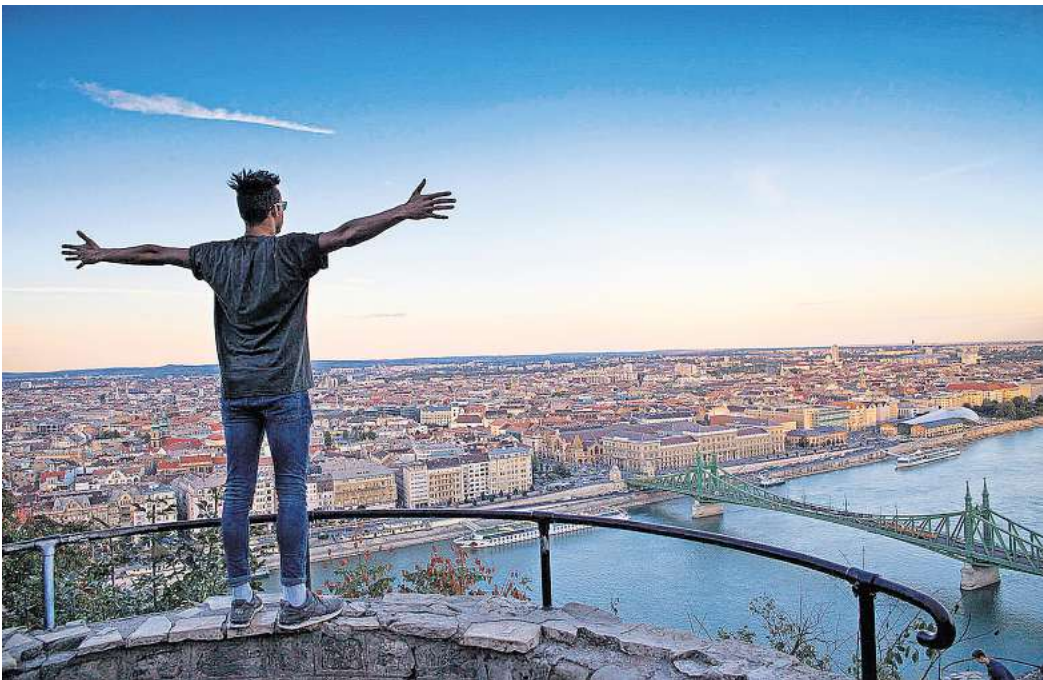
Reisefotografie: Die Gruppe LANDMARKer präsentiert ihre Bilder in der GAF.