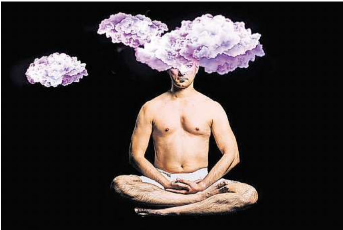
„Satyagraha“ eröffnet die neue Spielzeit.