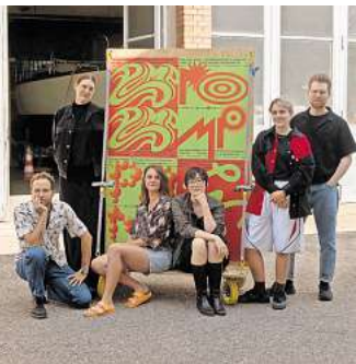
Zum ersten Mal beim Zinnober dabei: Atelier Pomp