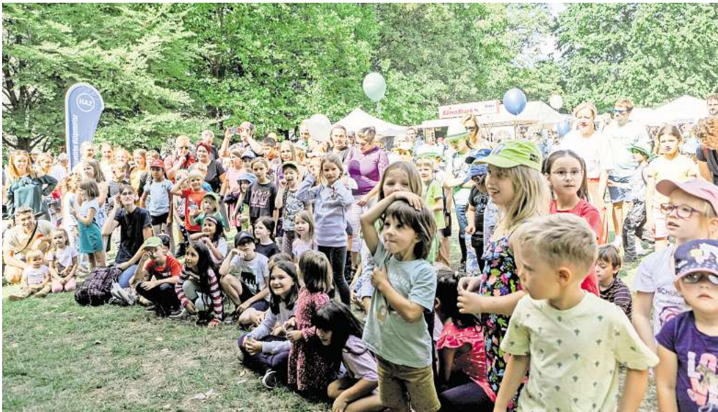
Das Einschulungsfest mit einem Programm rund um Verkehrssicherheit hat Tradition.

Das komplette Programm mit allen Aktionen ist kostenlos, es läuft von 11 bis 17 Uhr. Der Maschpark liegt in direkter Nachbarschaft zum Neuen Rathaus. Und natürlich kann man dort bei dem Familienfest auch die Einschulung gemeinsam gebührend feiern, Picknickdecken ausbreiten und sich kulinarisch versorgen lassen.