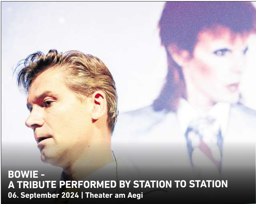
BOWIE - A TRIBUTE PERFORMED BY STATION TO STATION 06. September 2024 | Theater am Aegi