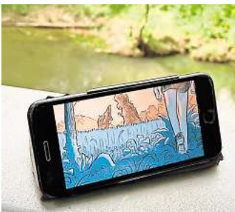
Unfollow now: Wanderung, Hörspiel-Animations-Theater und Graphic Novel.

paket. Das künstlerische Material darin begleitet die Wandernden über ihr eigenes Smartphone. Neben einem Hörspiel und Animationen der Graphic Novel bietet es viele philosophische bis biologische Anregungen und Gedankenströme, sich mit der Erde und dem Einfluss des Menschen zu befassen. Denn darum geht es in Jüligers „Unfollow“: Ein siebenjähriger Junge mit Erinnerungen an die Entstehung der Erde