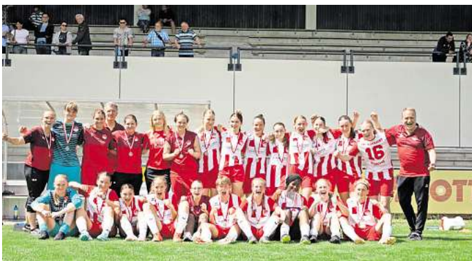
Die B-Juniorinnen des VfL Eintracht Hannover stehen im Finale um den Norddeutschen Pokal.