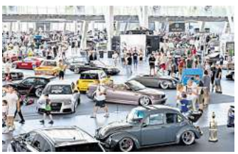
Zahlreiche Fahrzeuge gibt es auf den PS Days zu bestaunen.

Wir verlosen 10 x 2 Freikarten. Einfach den unten stehenden QR-Code scannen und Daumen drücken. Der Restweg ist wie immer ausgeschlossen.