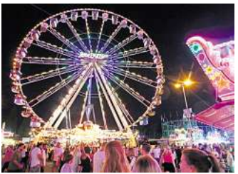
Buntes Treiben auf dem Hannover-Schützenfest.

Gibt es auch Schausteller, die nicht nach Hannover kommen wollen? Ja, die gibt es. Entweder, weil eine andere Veranstaltung in zeitlicher Nähe zum Schützenfest wirtschaftlich attraktiver ist.