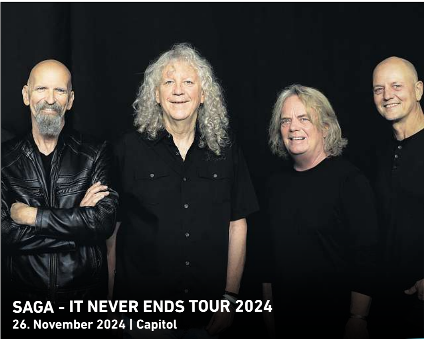
SAGA - IT NEVER ENDS TOUR 2024 26. November 2024 | Capitol

► Weitere Termine und Tickets: staattstheater-hannover.de