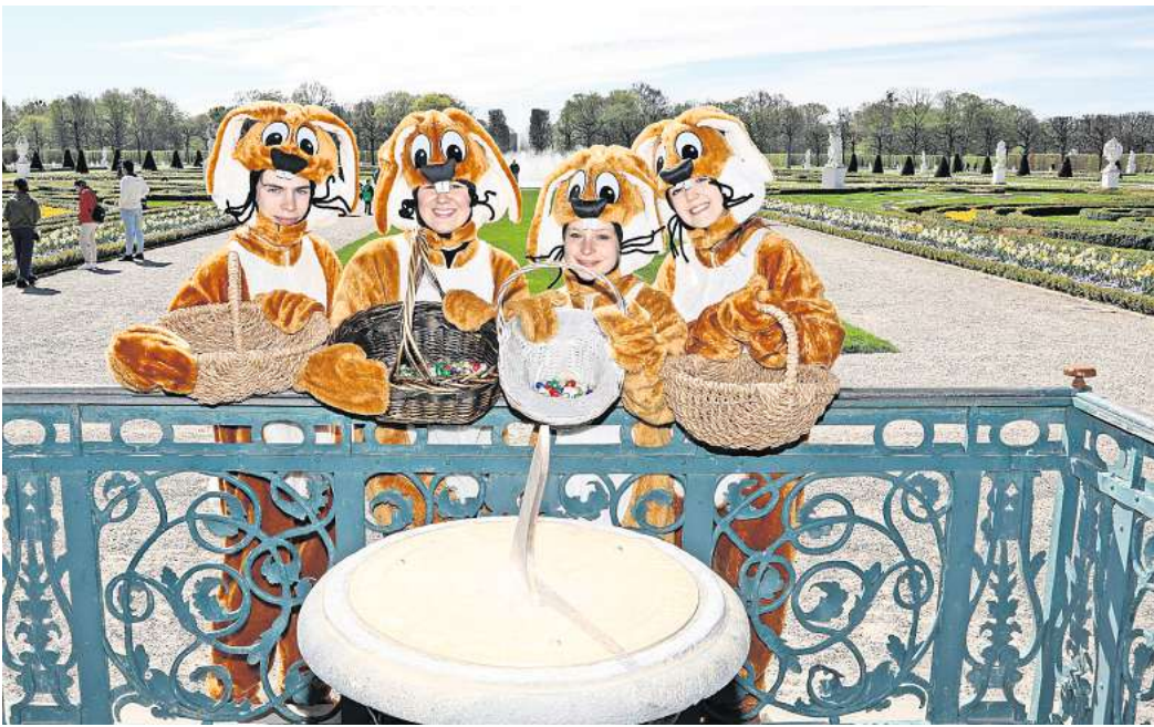
Die Herrenhäuser Gärten laden wieder zum Osterspaziergang mit Programm ein. Natürlich mit dabei: Die Osterhasen mit ihren Körbchen voller süßer Überraschungen.