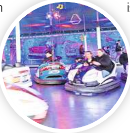
Es geht wieder rund auf dem Frühlingsfest.