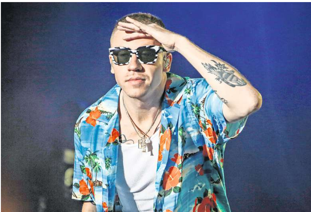
Macklemore bringt am Freitag bei der N-Joy Starshow die Plaza zum Beben.

of ‘69“, „Somebody“ und „It’s only love“ (mit Tina Turner) machten ihn in der Folge zu einem Superstar. Als Meister der gepflegten Rockballade erwies er sich in den Neunzigerjahren mit „(Everything I do) I do it for you“, der Titelmelodie aus „Robin Hood – König der Diebe“, und dem mit Sting und Rod Stewart aufgenommenen Lied „All for love“ (aus dem „Die drei Musketiere“-Soundtrack von 1994). In den vergangenen Jahren machte Adams sich auch einen Namen als Fotograf, oft von Kollegen. So stammt von ihm das Mo-